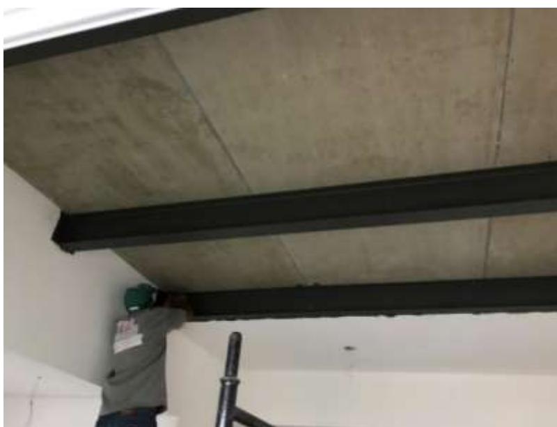
IMAGEM 07: Foto demonstrando como ficaria o reforço com viga metálica.

d) Quarto passo: Inserções das vigas metálicas que serão fixadas através das chapas e parafusos na estrutura de concreto existente. As vigas podem entrar seccionadas em dois ou três trechos para facilitar a execução, realizando a solda entre os trechos posteriores ao posicionamento de projeto. As peças metálicas já devem ser inseridas tratadas e pré pintadas;