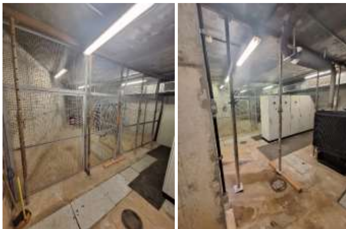
IMAGENS 01 E 02: Estrutura já escorada. Será necessário remanejamento das escoras para execução do reforço.

b) Segundo passo: Retirada dos equipamentos que estão no trecho onde serão inseridas as vigas metálicas (instalações da subestação, gerador e central de água gelada). Neste cenário será necessário a retirada e instalação de itens como luminárias, eletrodutos, cabos, e gradil de proteção da subestação, bem como relocação do gerador e chiller, retirada da tubulação de aço do sistema de água gelada, retirada de eletrocalhas, eletrodutos, cabos e instalação de tapumes para proteção do transformador.