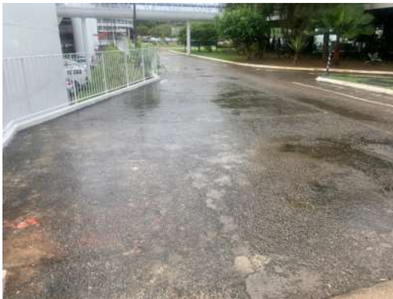
IMAGEM 06: Piso atual sobre a laje de cobertura da subestação ineficiente.

d) Quarto passo: Inserções das vigas metálicas que serão fixadas através das chapas e parafusos na estrutura de concreto existente. As vigas podem entrar seccionadas em dois ou três trechos para facilitar a execução, realizando a solda entre os trechos posteriores ao posicionamento de projeto. As peças metálicas já devem ser inseridas tratadas e pré pintadas;